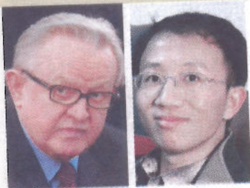
Martti Ahtisaari: Fikk pris.