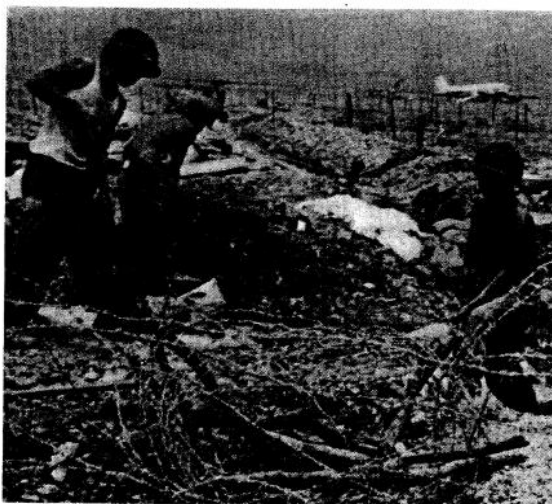
Til venstre: Ho Chi Minh, president i Vietnam fra 1945, ved undertegningen av overenskomsten med Frankrike i mars 1946. – Til høyre: Fra kampene om Dien Bien Phu, den franske fjellfestningen i det nordlige Vietnam, anlagt 1953 for å avskjære Vietminh-styrkenes forsyningslinjer gjennom Laos. I mars 1954 omringet nordvietnamesiske tropper under general Vo Nguyen Giap festningen og angrep med tungt artilleri, inntil de franske styrkene etter store tap kapitulerte 7. mai 1954. Etter full militær kapitulasjon hadde det franske koloniveldet i Indokina opphørt å eksistere.

de bukket under for thaiene på 1400-tallet var Mekongdeltaet bare tynt befolket. En annen gruppe innvandrere kom imidlertid vietene i forkjøpet: kinesere. Da mandsjuene erobret Kina midt på 1600-tallet, flyktet mange kinesere sørover med skip. Noen av dem slo seg ned ved Saigon-elva. Snart etablerte vietene en bosetning på den andre siden av elva. Dermed oppstod handelsbyen Saigon-Cholon, som i 1976 fikk navnet Ho Chi Minh-byen.