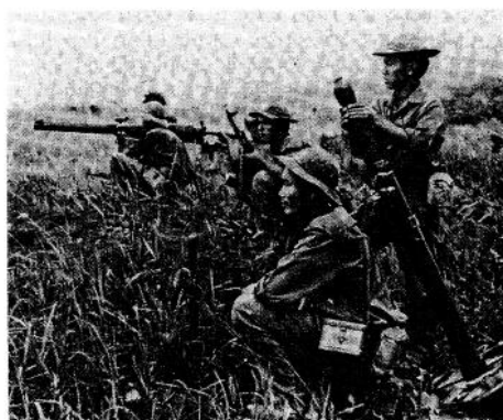
Øverst: Under Vietnamkrigen ble landet utsatt for kraftig bombing fra amerikanske B-52-fly. Det ble sluppet flere bomber under Vietnamkrigen enn under hele den annen verdenskrig. Følgene vil være synlige og merkbare for menneskene og naturen i flere generasjoner. – Nederst: Soldater fra FNL, den Nasjonale Frigjøringsfront i Sør-Vietnam, under forberedelser til offensiven i 1975.

vietnameserne. Da de amerikanske troppene drog seg tilbake i 1973, tok det likevel bare to år før Sør-Vietnam bukket under for nordvietnamesiske angrep.