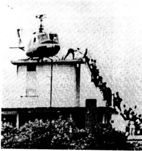
I slutten av april 1975 falt Saigon, etter at den sør-vietnamesiske hæren var gått i oppløsning. I byen oppstod det kaos og panikkartet kamp for å komme seg ut sammen med amerikanerne. Bildet viser evakuering med helikopter fra taket på den amerikanske ambassaden 29. april.

etter inspirasjon fra Gorbatsjovs perestroika i Sovjetunionen, dels fra Deng Xiaopings reformer i Kina. Den nye politikken ble lansert av generalsekretær Nguyen Van Linh (1986–92) under slagordet Doi Moi. Private husholdninger fikk tilbake sin råderett over rismarkene, noe som førte til en kraftig produktjonsvekst: Vietnam ble en av verdens tre største ris-eksportører. Handelen ble også sluppet fri, noe som førte til en kapitalistisk revolusjon og en total forandring av gatebildet i byene. Betydelige utenlandske investeringer bidro til sterk økning i eksporten av sko og tekstiler, kaffe og andre jordbruksprodukter, samt sjømat. Et vietnamesisk-russisk joint venture (Vietsovpetro) fikk fart i oljeproduksjonen, noe som gav staten store inntekter. Ved Sovjetunionens oppløsning falt imidlertid vennskapspakten og den