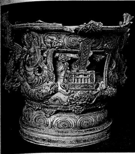
Vietnamesisk kunst bærer preg av kinesisk og indisk innflytelse. Ved siden av lakkarbeid er Vietnam kjent for ypperlige keramikkgenstander, som dette røkelseskarer fra 1600-tallet (til venstre). Det viser slektskap med kinesisk keramikk. – Til høyre: I nyere tid har kunst i sosialistiske stater gjerne blitt brukt politisk. Partiledere blir ofte fremstilt i gigantstørrelse. Ho Chi Minh-bysten på bildet er et slikt eksempel.