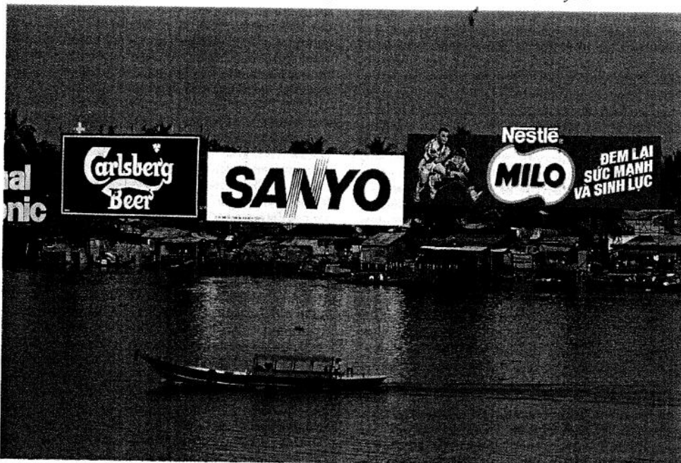
Landets sosialistiske system er blitt stadig mer påvirket av kapitalismen. Et eksempel er disse store reklameplakatene for internasjonale konserner, ved Mekong-elven i nærheten av Ho Chi Minh-byen.

2. Motordrevet ventilator til å frembringe lave luft- eller gasstrykk (fra noen ganske få VS (vannsøyle) til ca. 500 mm VS). Energioverføring til gassen skjer ved et roterende hjul med faste skovler som øker trykk