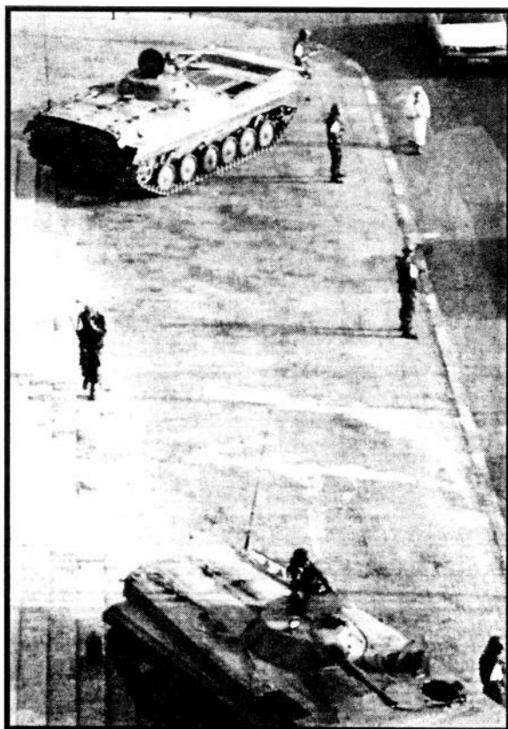
«Vesten må ikke støtte et militærstyre mot en islamsk folkebevegelse, som i Algerie.»

Før eller senere kommer islamistene til å overta i Algerie, og da gjelder det å unngå at de nye lederne slår inn på en total ekstremisme. «Ikke en gang til!» skriver Economist ved siden av et stort oppslått bilde av en korsridder som stikker sverdet i en araber.