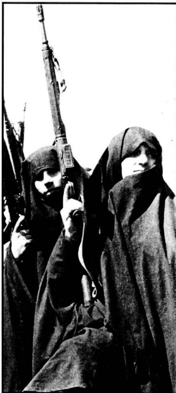
Det nye fiendebildet.