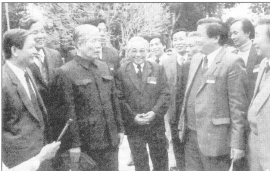
Ved kommunistpartiets midtvejskonference i januar 1994 ses generalsekretær Do Muoi sammen med nogle af de delegerede. Men demokrati må også inddrage andre end partimedlemmer.

Udviklingen af demokratiopfattelsen i Øst- og Sydøstasien vil have afgørende