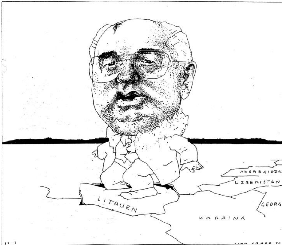
Gorbatsjovs reformer ga støtet til imperiets oppløsning. Mangler han forståelse for nasjonale spørsmål?